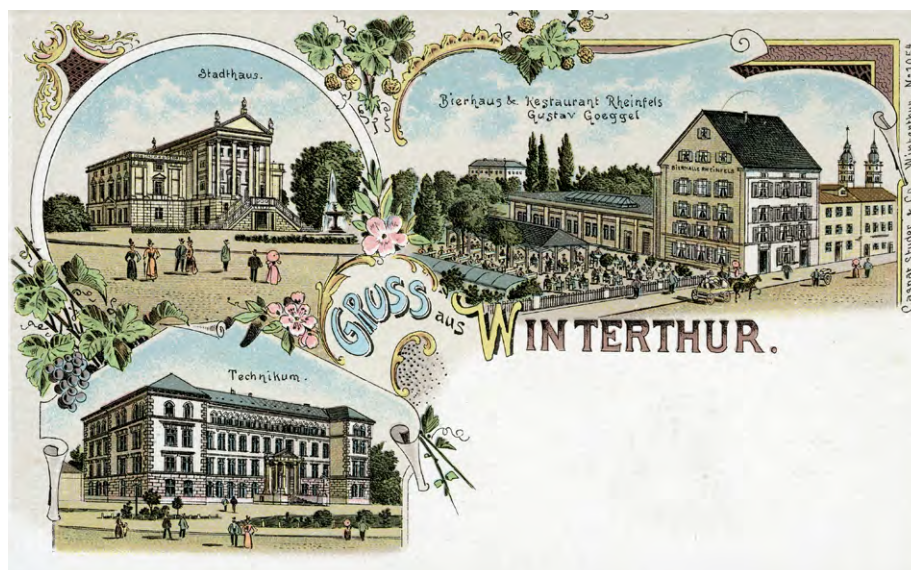
Abb. 5: 1899. Das «Brauhaus Rheinfels», damals landläufig bekannt als «Göggel», war beliebt bei Akademikern. Auch Autenheimer traf sich dort oft und noch öfter im «Casino» mit wichtigen Beamten des Stadthauses (Bau: Gottfried Semper, 1869) zu Gesprächen – auch über das Technikum (Bau: Theodor Gohl, 1879) (winbib sig. 35_01).

Eine fortschrittliche Spezialität wurde bereits damals etabliert: «Arbeiterkurse», heute spräche man eher von Fortbildungskursen oder gar von CAS. Diese Kurse betrafen Einzelthemen: Zeichnen, Algebra, Geometrie, Rechnen etc. Bemerkenswertes zum Arbeiterkurs im Wintersemester steht auch im ersten Schulbericht (Programm (1874/75), Seite 5: «Unter den Theilnehmern (sic!) am Sonntagskurs befanden sich 7 junge Da-