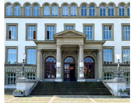
Abb. 1: Winterthurer Technikum, Hauptgebäude (2024).

vielsagenden Titel: «Ein Technikum für die Schweiz» mit einem eingeklammerten und doch interessanten Untertitel «(Ein Vorschlag aus Basel)» (in: e-newspaper-archives.ch). Dabei war der Autor, Friedrich Autenheimer (1821–1895), gebürtiger Aargauer von Stilli und leitete dazumal