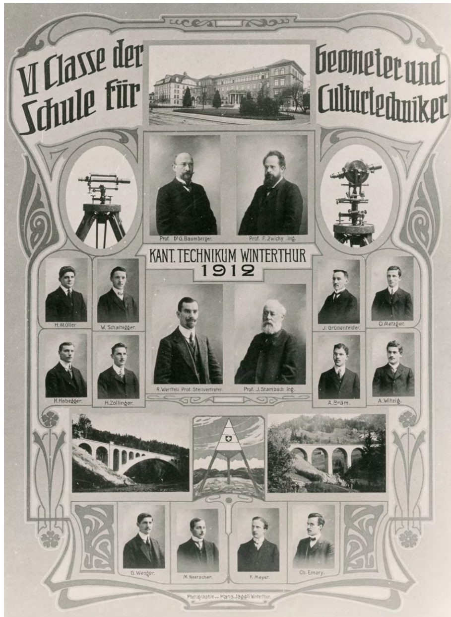
Abb. 6: «Klassenfoto» einer der letzten Abschlussklassen (VI. Semester), die ihre Geometer-Ausbildung in Winterthur abgeschlossen haben. Nach ihnen schlossen bis 1916 noch vier Klassen ab, dann war Schluss. Abgebildet sind auch die damaligen Hauptlehrer der Geometerschule. Unter den Schülern sind bekannte Geometernamen zu entdecken. Der schöne Zufall will es, dass genau diese Klasse sich 1962 zum «50-Jährigen» wieder fand und W. Schaltegger in der VPK (Band 60 [1962] Heft 10) einen kurzen aber aufschlussreichen Bericht verfasst hat (winbib, sig. 052843).

Prof. Zwicky wurde beauftragt, einen Lehrplan für eine Tiefbauschule zu entwerfen. Da Zwicky auch Fächer im Bereich