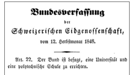
Abb. 2: Im Bundesblatt 1849 Bd. 1, Heft 1 (24.02.1849) wurde die Bundesverfassung publiziert. Unter den 114 Artikeln (ohne Übergangsbestimmungen usw.) findet sich auch der ominöse Artikel 22.